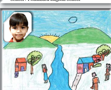
Title: Scenery By: Diti School: KVS Lamphel