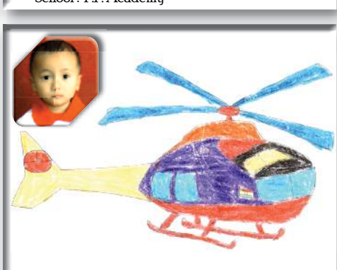
Title: Helicopter By: Thawanthaba W. School: Premier English Academy