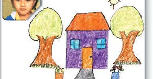
Title: A House By: Jacqueline School: Heritage Convent