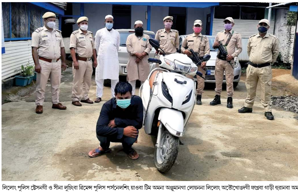
লিলোং পুলিস ষ্টেশনগী ও সীনা লুচিবা ৰিমেল পুলিস পৰ্সনেলশিং যাওবা টিম অমনা অগ্ৰমানগা লোয়ননা লিলোং অতৌখোঙদী ফাৰা গাড়ী ছৱানবা অমা

গুৱাহাটী, মে ০৩ (এজেসী): ইন্দিয়াগী অৱাং নোংপোক থংবা শৰুজা লৈরিবা ষ্টেটশিংগী মনুংদা মৰু ওইনা অসাম, মণিপুর অমসুং মেঘলয়াদা কোভিড-১৯ গী কেস তথা তথা মণীং হেনগৎলক্কি হায়না যুনিয়ন হেল্ঠ মিনিট্টিনা ফোণ্ডেদোরক্কি।