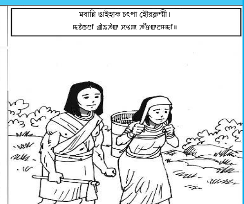
অসিজোলনেং ৱেট্টেবৎৱা শ্ৰৌৱ অমসুং আৰ্ট: সামন সলাম