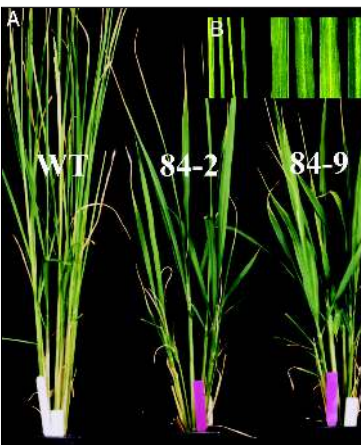
(A) থা অনী ফারবা ফৌ পান্দি স্কিকনা থোকহনবা ট্বেসকী রেপ্পোল য়েংবা। WT- wild type; 84-2 অমসুং 84-9 = transgenic rice (B) Wild type শিংদা ফৌ মনা খুঁইশিল্লকপা (ওই থংবা শরক্ক)

পান্দি হায়বসি মশা মথল্লা মচিঞ্জাক শুংজবা গুন্ন মালেম অসিদা লৈরিবা মীওইবা অমসুং শা-ঙা কয়গী চিঞ্জাক্কী হৌরকফম ওইদনা ফুদ চেন সিষ্টেমা মশা ইথং-থংনা লেবা জীব অমনি।