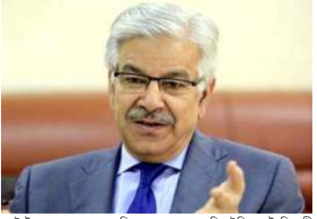
ইন্টরভ্যু অদুনা খ্বাজা অসিফনা হায়খি, টেরিষ্ট অমবু প্রাইম মিনিষ্টর ওইনা খনবা লৈবাক অমগী মরমদা ঐথোয়না করি হায়গনি। 'য গুণক-শেনবগী মীংদা ইন্দিয়াদা মুসলিমশিং অমসুং দলিটশিংবু হাংলি হায়না অসিফনা মথা তানা হায়খি। পাকিস্তানগী প্রাইম মিনিষ্টর শহিদ

ইসলামাবাদ, ওক্টোবর ০৩ (এজেসি): য়ুনাইটেড নেসন্সতা ইন্দিয়াগী ফোরন মিনিষ্টর সূশমা স্বারাজ অমসুং পাকিস্তানি ডিপ্লোমেটশিং অমসুং প্রাইম মিনিষ্টরগী মরজা রাইগী অকনবা লান অমা শেক্কাখিবা নুমিং খরনিগী মতুংদা অতোপ্লা পাকিস্তানগী মিনিষ্টর অমনা ইন্দিয়াবু টেরিষ্টশিংনা লৈঙাকই হায়না ফোঙদোকখি। নিংথৌকাবা নুমিংতা জিও টিভিগী ইন্টরভ্যু অমদা পাকিস্তানগী ফোরন মিনিষ্টর খ্বাজা অসিফনা হায়খি মদুদি, সূশমা স্বারাজনা পাকিস্তানবু টেরিষ্টজম এক্সপোর্ট তৌই হায়না মরাল শীরোইদবনি মরমদি ইন্দিয়া অসি হৌজিক টেরিষ্ট অমনা রন তৌরি। মহাক্কা আর এস এসপু টেরিষ্ট আউটফিট অমনি হায়খি অমসুং আউফিট অসিনা ইন্দিয়াবু লৈঙাক্কে অমসুং বি জে পি অসি ওগ্গাইজেসন অসিগী শরুক অমনি হায়না ফোঙদোকখি।