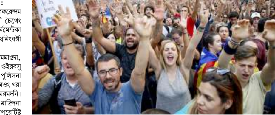
মশাগী চহী ৬৫ সুরবা নীংতন্না শৌগংপা অমনা এ এফ পিদা ফোঙদোকখি। পুলিসনা পোলিং স্টেশনশিং থিংজিববা হেংনরকদা অথিবা পীরকশিংবু ফাবা, মীওই খরা মশম পায়রগা ঙিবা নংত্রগা মথোয়দা বেটনশিং শীজিবদা ফুৎগী ফুটেজ মাদিয়ারা অমসুং সোসাল নেটওয়ার্কশিংগী খুথান্দা চাইথোকখি হায়রি। রিজনেল ওখোরিটিশিংগী মতুং ইন্না, পুলিসকী কা হেনবা যৌওংখি অদুনা মরম ওইদুনা মীওই ৯০০ লায়কমখি। পুলিস এজেন্ট ৪০ রোমসু মেডিকেলগী মতুং চঙখি হায়না ইন্টারিয়র মিনিষ্ট্রনা ফোঙদোকখি। যৌওং অসিনা লৈবাক অসিগী স্পিচিটতা শোকহল্লে, মদু ইকায়বা পীবগী যৌওংনি হায়না এহাক্কা খন্দে মরমদি মদুস্তি অকবা রাইহে অমনি। তৌইগুসুং য়েস শৌগংপশিং অমসুং নো শৌগংপশিং অনীমজা পুলিসকী যৌওং অদুনা শোকহনখি হায়না ক্রেসদো ফোঙদোকখি।