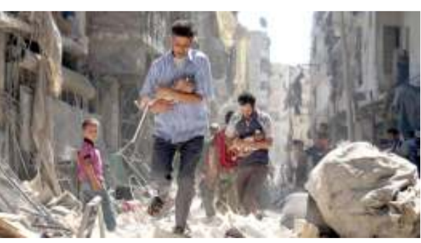
'ঐথোয়না ইন্টারনেসেল কো-লিসনদা মসিগী এঞ্জিটিটিশিংগী মরমদা রিপোর্ট মতিক চানা তৌনবা, ইন্টারনেসেল লোবু ইকায় খুন্নে হায়বদু অমুক হেনা উৎখিবা অমসুং সিরিয়ন মীয়ামগী মীংথোংশিং অমসুং তঙাইহল্লে অপাসুশিং উৎখিবা কনক্টিষ্ট অদুগী পোলিটিকেল সোলুশন অমা পুরক্কা মথা তানা হেংনববা অঙ্গীল তৌরি। হন্দুতা হুয়মন রাইটস রাটচকী রিপোর্ট অমনসু হৌথিবা মার্চতা সিরিয়গী অরায় থংবা সিটি তবকাদা য়ু এসকী এয়রক্রাফটনা স্কুল অমগা ইন্টারনেসেল লোবু ইকায় খুন্নে হায়বদু অমুক হেনা উৎখিবা অমসুং সিরিয়ন মীয়ামগী মীংথোংশিং অমসুং তঙাইহল্লে অপাসুশিং উৎখিবা কনক্টিষ্ট অদুগী পোলিটিকেল সোলুশন অমা পুরক্কা মথা তানা হেংনববা অঙ্গীল তৌরি। হন্দুতা হুয়মন রাইটস রাটচকী