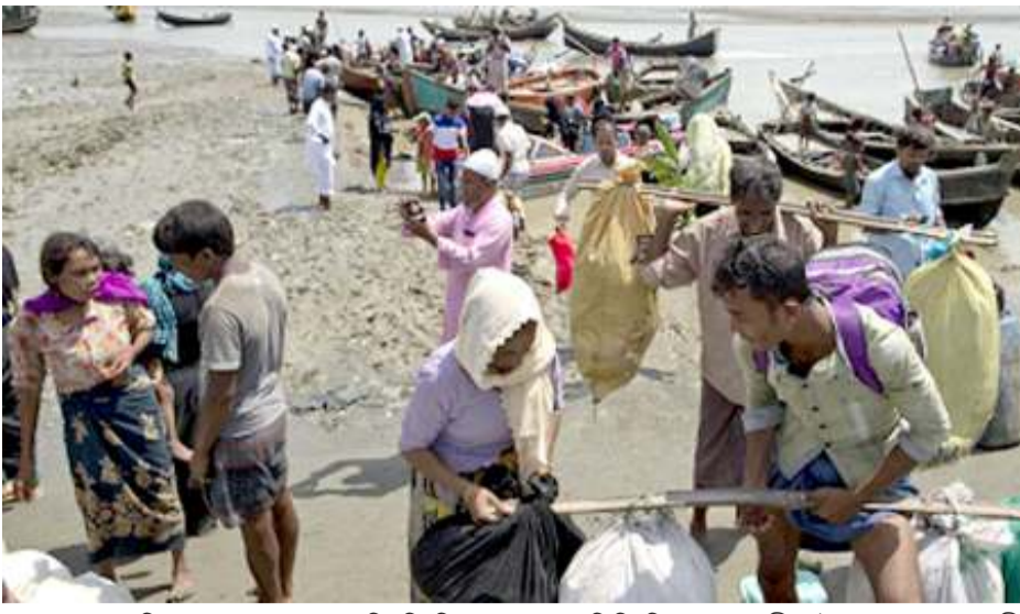
মচা অমদা থংলরি হায়না গ্লোবেল ন্যা লাইট গুফ ম্যাম্মারনা ফোঙদোকখি। ম্যাম্মার গভর্নমেন্টনা রোহিংয়াশিংবু ইথনিক গ্রুপ অমা ওইনা শকখঙু হায়বা যাদ্দি। অসুন্না শকখঙু বগী ম্হৎতা ম্যাম্মারনা রোহিংয়াশিংবু

যাঙ্গোন, ওক্টোবর ০৩ (এজেসি): চীঞ্জাক ফংজিল্লত্ৰবা অমসুং মথোয়বু তাথিবা হেনগংলকপদনী রখাইন স্টেটতগী রোহিংয়াশিং চেনবা লেপুংগা লায়ননা বাংলাদেশকা ম্যাম্মারগা ফাওনফম অমগী মনাজা রোহিংয়া ১০,০০০ হেনা পুনশ্চে হায়রি। হৌথিবা খাদনী রোহিংয়া ৫০০,০০০ হেনা বাংলাদেশতা চেনশ্রবা ঈরাংগী ফিভম অদুনা মাইনোরিটি মুসলিমশিং হল্পকহনবগী প্রেসোস হৌবগনি হায়না ম্যাম্মারনা নিংথৌকাবা নুমিংতা ফোঙদোকখিবা রাফম চিংনিঙাই ওইরি। চয়োল কয়ানিমুক অসিদা রখাইন স্টেটতগী রোহিংয়া কাঙলপকী অপনবা মীশিংগী তঙাই অমা হেনা য়ুস্লোমবা বাংলাদেশতা চেনশ্চে। হৌজিক ফাওনগী ওইনা কাঙলপকী অকনবা ঈরাংমজি থোজ্জিবা স্টেট অদুদনী রোহিংয়াশিং সিক্যুয়িটি লৈতকদনী চেনবা লেগ্গি। মুসলিম ১০,০০০ হেনা লেটরেকয়ী অমসুং কুক্ৰনখিন ডিলেজগী মরজ লৈবা উমং