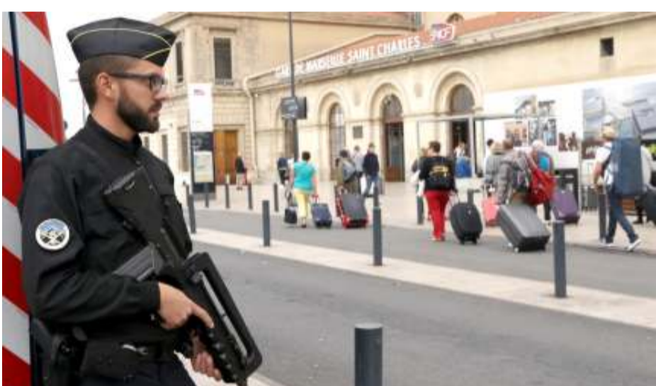
পেরিসকী নিংখীরবা ১৬ শু বা ডিষ্ট্রিক্টতা লৈবা বিল্ডিং অমগী মনুংদা গ্যোস কেনিষ্টর অনী যাওরমখি। অতোপ্লা অনীনা মপানদা লৈরমখি লোয়ননা কেনিষ্টর খরদি পেট্রোল হৌজিল্লমখি অমসুং মোবাইল ফোন অমগা রাইঅরগী খুথান্দা শল্পরমখি। টার্গেটনি হায়বা য়াবা অমংতা লৈতবা মফমদুদী কল্পনা ডিভাইস অদু থল্লিবনো

পেরিস, ওক্টোবর ০৩ (এজেসি): পুলিসনা হৌথিবা চয়োলগী অরোইবা শরুক পেরিসকী খুইদগী নিংখীরবা নেবরহুদশিংগী মনুংদগী অমদা লৈবা এপার্টমেন্ট বিল্ডিং অমদা পোকখায়হন্নগীদমক শেম-শারবা বোম অমা থেংনখিবা মতুংদা ফ্রেঞ্চ কাউন্টর-টেরিষ্টজম ইনভেস্টি-গেটরিশিংনা লৈবাকপোকপা নুমিংতা মীওই মচা রাহং পাউহং চখাশ্চে। ইন্টারিয়র মিনিষ্টর জেরার্ড কোলমনা হায়খি, ফারবা মীওইশিংদুগী মনুংদা অমদি ইন্টিলিজেন্স সার্ভিসনা শেন্দ্ৰা কা হেনবা রাখল চলহল্লেবা মীওইশিংগী লিষ্টতা মীওই। লিষ্ট অদুদা ইন্সামিষ্ট মিলিটেন্টশিং ওইরকপা য়াবশিংগী মমিংশিং য়াওরি। হৌজিকসু ঐথোয় লানগী ফিভম অমদা লৈরি হায়না নোংমাইজিং নুমিংকী এটেক অমগী মতুংদা রা গুাওখিবা কোলননা ফ্রান্স ইন্টার রেদিওদা হায়খি। নোংমাইজিংগী যৌদোক অদুনা মার্সিটি সিটিদা খাঙ মচা পায়বা মীওই অমনা নুগী অনী হাংখিবনি। জুদিসল সোছশিংনা হায়খি, এক্সপ্লোসিভ ডিভাইস অদুনা রেপ্টন