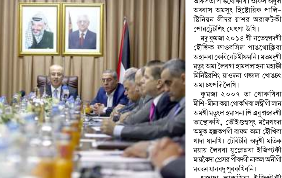
ফাওনগী মনুংদা অহানবা ওইনা পাওথোকখিবা মীফম অদু হৌদোকপগী রাংরোলদা প্রাইম মিনিষ্টর রাহিম হমদালাহনা গজা কন্ট্রোল তৌরিবা ইন্সামিষ্ট হমাস মুভমেন্ট অমসুং রেপ্ট বেহুতা বেজ ওইবা মহাক্কা গভর্নমেন্টকী মরজ চহী ১০ তোঙানা তানরকখিবদু নোংমাইজিলগনি হায়না নৌহৌননা চেংনা ফোঙদোকখি। খাইবুং খাইবুং তানবগী যৌওং লোইশিবগা, নেসেল প্রোজেক্টপু অমুক হেনা অচুনা মায়কৈদা চংহরবা অমসুং পালিষ্টিনিয়ন স্টেট অমা লিংনবা ওসি ঐথোয় মফমসিদা পল্লিবনি হায়না মহাক্কা ফোঙদোকখি। সেসন অদু গজাদা লৈবা পালিষ্টিনিয়ন প্রিসিডেন্ট মাহমুদ অবাস ওফিসল রেজিডেন্সতা থন্না কেবিনেট

গজা সিটি, ওক্টোবর ০৩ (এজেসি): মালোমনা শকখঙলবা পালিষ্টিনিয়ন ওখোরিটি (পি এ) না গজাবু অমুক হেনা পালিষ্টিনিয়ন য়ানবগী মায়কৈদা থাংলকপা অহনবা থোঙথং অমদা লৈবাকপোকপা নুমিংতা টেরিষ্টর অদুনা পালিষ্টিনিয়ন কেবিনেট মীফম পাওথোকশ্চে। কুমজা ২০১৪ দগী হৌজিক