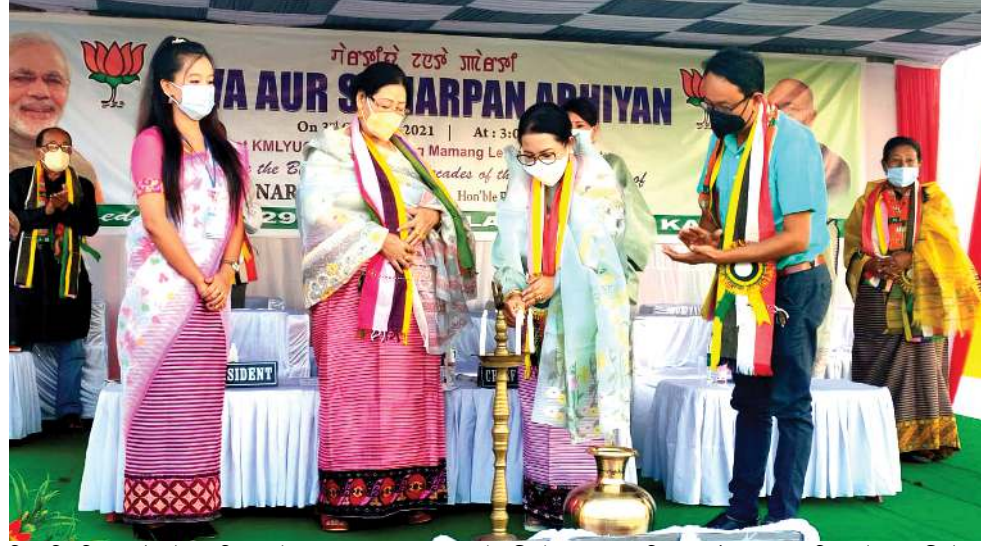
বিজেপি মহিলা মোৰ্ণ, কাইৱনা শিন্দুনা কাইৱং মমাং লোকায় কে এম এল এল হুইয়ানী গ্ৰাউন্ডনা পাঙথোকখিবা সেবা ওঁৱৰ সমৰপন অজিনা হৌদোকপগী থৌৱম