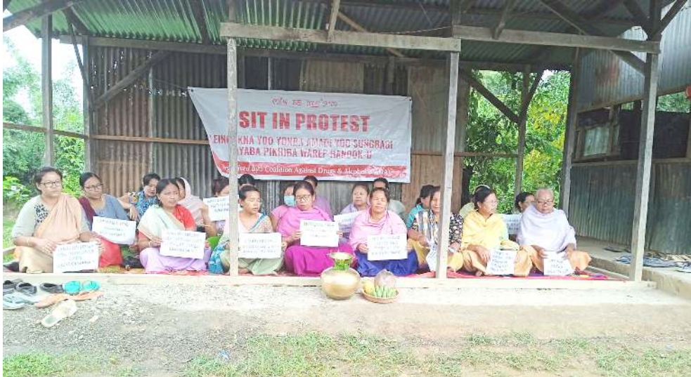
য়ু লিগেলাইজ তৌৱা য়াৱেই হায়ৱদুনা কোছৌজম অমসুং কৈৱাওদা কোলিসন এগেনষ্ট ব্ৰগস এন্ড অলকোহোল শিন্দুনা পাঙথোকখিবা ৰাকং মীফম

গ্ৰুপ-২০১৫ বেটচনা মখা তানা ফোঙদোকখিবা, এদহোক ওজা শিং অসি ফংলিবা থাগী শেনফম অসি য়াম্মা পীকপা শেনফম। মৱম অদুনা ওজাশিং অসিবু ৰিগুৱলহিজ তৌৱিবা কয়াৱক হুয়া হায়জদুনা লাক্কি। অমৱোমদা এস এস এ অমসুং ৱমসাগী ওজা ৯০ লৈৱাক্কি ৰিগুৱলহিজ তৌৱে। মখোয়শিং অদুদি ওজা অমা ওইবগী চপ চাবা তোলাব ফংদুনা নুঙাইনা মথৌ তৌৱি। অদুগা এদহোকতা লৈৱিবা ওজাশিং অসিবুনা হুয়া য়েংবীদনা থম্ম। ওজাশিংনা য়াম্মা দেমোফ্ৰেটিক ওইবা মওদা চঙশিল্লিবা খোঙজং অসি লৈৱাক্কি তৱাইনা লৌৱা তৌৱিগানু। দিমাৰ্শিং ফংলিবা ফাওবা ওজাশিং অসিগী খোঙজং হন্দোকপা তৌৱেই হায়না মখা তানা ওজা শিংনা ফোঙদোৱাক্কি।