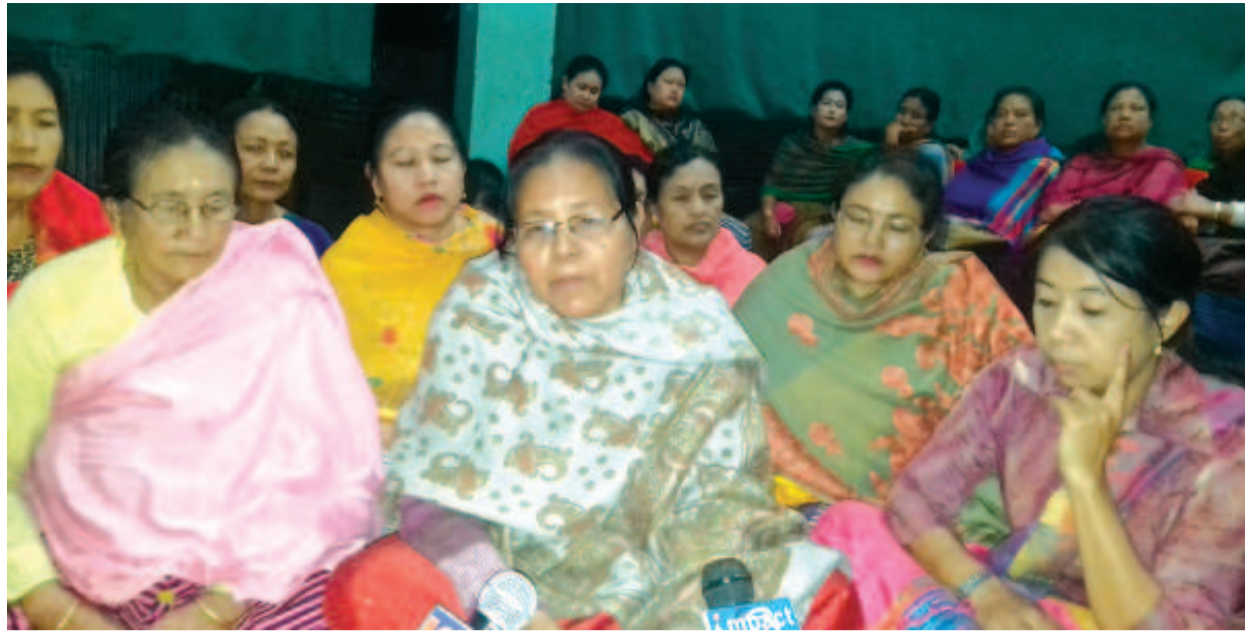
বেঙ্ক ফ বরোদাদগী শামিযা চেক্ৰা শেল লৌথোকখিবগী মতাংদা থিগৎপিনবা তেরাগী নৈনশঙ কম্মুনিটি হোলদা বাকৎ মীফম ফমখিবগী শক্তম

টোম্বায়েম/খৌনাও নাকন অনীদা পোমথোরকপা, লৈতেনদা চাথৎপা, খৌনাও মনুংদু চাথৎপা, তিন য়োৎশিনবদা য়ান্না নাবা, করিগুন্না অমা চাবা মতমদা খৌনাও মনুংদা য়ান্না নাবা, চানিং থক্ৰিংবা পোক্তবা, খৌনাওদা মরেং মরেং চৎপা ফহনবগী ওজা জিয়া উল হকপু থাগৎচরি