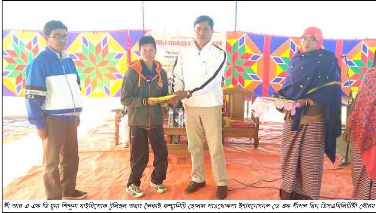
সী আৰ এ এফ ডি যুনা শিন্দুনা যাইৰিপোক ট্ৰাইলছ আৰং লেকাই কম্পানীট হোলদা পাউথোকপা ইণ্টাৰনেশনেল ডে অফ পীপল বিশ্ব ডিসএবিলাৰিটিগী যৌৰম

ট্ৰাফিক/ফন্বী ব্ৰাংপা, পাজলগী শক্তি ব্ৰাংপা, থাণী খোঙকাপ চাং নাইদবা, ফিডৌ য়ান্চা চংপা, হকচাংখোংদা মনম নমথাবা, তোলহাও তোয়না ফাইবা, খোঙ তোয়না হান্চা, অমাঙখোং ময়াদা মচা অমা পোমখোরকপা, তাং তাং চিকপা নাবা, মসল পেন ওইবা ফহনবগী ওজা Zia-UI-Haque পু খাগচরি