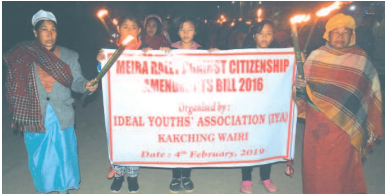
সিউজিএনআই (এমএমএসই) বিল ২০১৬ পু য়ানিহন্দা ফোঙদেল্পনুনা আই রাই এ ককচিনা শিল্পা চংখিবা মৈরা রেঞ্জি

ট্রায়েংফ্রে/অমাংথোং ময়াদা কাৰ্কে অমুনবগুয়া লৈবা, খোঙ হায়া চাং নাইদবা, খোঙ হায়া মতম কুইনা চঙবা, পুজা য়েকুগা খোঙ হাল্লিংলগতা লৈবা, অমাংথোং মনুংদসু পোহা, অমাংথোংগী অকায়বদ মরেং মরেং হাক্কৎচবা, হাক্কৎচবা অদু খোংপা মতমতা অমাংথোং চাউখৎলকপা ফহনবগী ওজা জিয়া উল হকপু খাগৎচরি