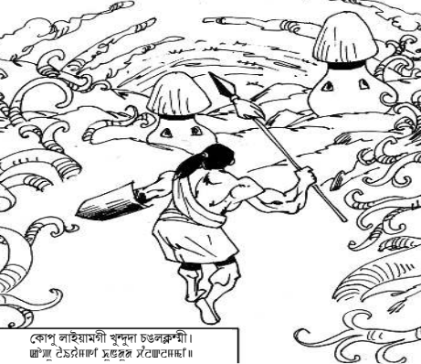
কোপু লাইয়ামগী মূদুনা চঃশিমাৰী। ঞ্ৰাংগা ঞ্ৰাংগা ঞ্ৰাংগা ঞ্ৰাংগা ঞ্ৰাংগা