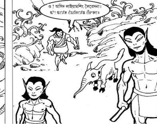
ও! অসিদি লাইয়ামগী লৈৱেননা! ঞ্ৰাংগা ঞ্ৰাংগা ঞ্ৰাংগা ঞ্ৰাংগা ঞ্ৰাংগা