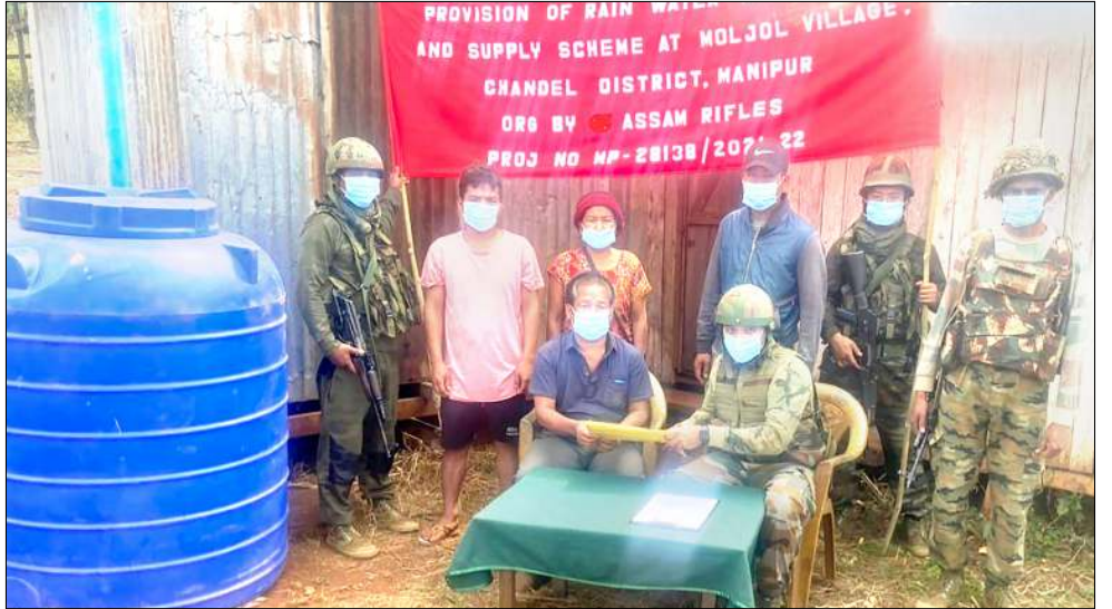
আই জি এ আর (সিউজ)কী লমজিং মখাদা সেলোন বটালিয়ননা নাংগী ঈশিং য়োকশিমবা পান্দমদা চান্দেল দিষ্ট্রিক্টকী মোলজোল খুঞ্জাশিংনা সিষ্টেম য়েহোকখিবা