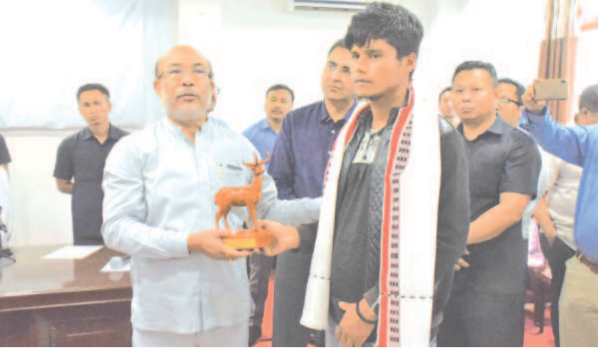
চন্দোং হি লাকপদা য়াওবিয়া মীওই ৯ কনবা অমসুং অশিবা অহুংগী হকচাং থিবদা য়োদাং লৌখিবা রমরৈ খুলগী খুঞ্জাশিংসী এমনা ইকই খুল্লাবা উথিবা

ট্যাম্পেসেপ/অমাংথোংদা য়ান্না চিকপা নাবা তৌরগা খাংফম খঙদবা, ফান অমদি চিয়ারদা ফন্বা ওমদবা, ফন্বা তারগসু চেপ্পা ফন্বা, খোঙ হান্না য়াদবা, খোঙ হান্নগসু হামেং মথিঙল্লা খজিক্তং হান্না, মরক-মরক্তা অমাংথোং মনুংদগী ঙৈ দ্রোপ দ্রোপ তারকপা ফহনবগীদমক ওজাবু মপোকসিগী কাওজরোই