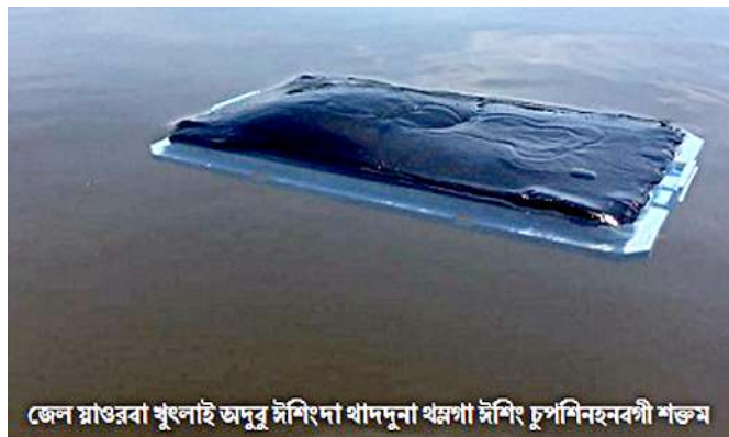
জেল য়াওরবা খুংলাই অদুবু ঈশিংদা থাদনা থল্লগা ঈশিং চুপশিনহনবগী শক্তম

মালেমগী লৈমায়সি ঈশিংনা শরুক অহম থোকপগী অনী কুপশিল্লবসু থক-চাবদা শীজিমগদবা ঈশিং (ফ্রেশ রাটর) গী চাংদি অসুকী মতিক নেম্মী, ২.৬% খক্তমক থক-চাবদা শীজিমবা য়াই। থক-চাবা য়াবা ঈশিংগী ৭০%দি উন ওইনা লৈয়ে, অদুগা লেমহৌরিবা ৩০%দুগী মনুংদা অয়াং ঈশিংসু মোংলবা, মখিক-মতাই চেল্লাব অমসুং হু ওইবা কেমিকেলশিং য়াংম্হা য়াওরিবনি। ঙসি এথোয়না থক্কাইবা বোটলদা হাল্লিবা ঈশিংদা মখিত্তি য়াওরমদবা য়াই অদুবু হু চেনবা কেমিকেলশিংদি শেয়দানা য়াওরমগনি। মরমদি মসিগী মতিক চারবা ট্রিটমেন্ট কনানসু তৌনবা নভে। য়ুনাইটেড নেসপকী মতুংইয়সু, মালেমদা লৈরিবা মী অহমগী মনুংদা অমদি শাকফা ঈশিং থকপা ফংদে হায়রি। অদুনা শেল ইচ চঙদনা হু চেনবা কেমিকেলশিংবু লৌখোকপগা লোয়ননা মখিকশিংবুসু হাংপা হায়বসি য়াংমক মরু ওইরক্কা।