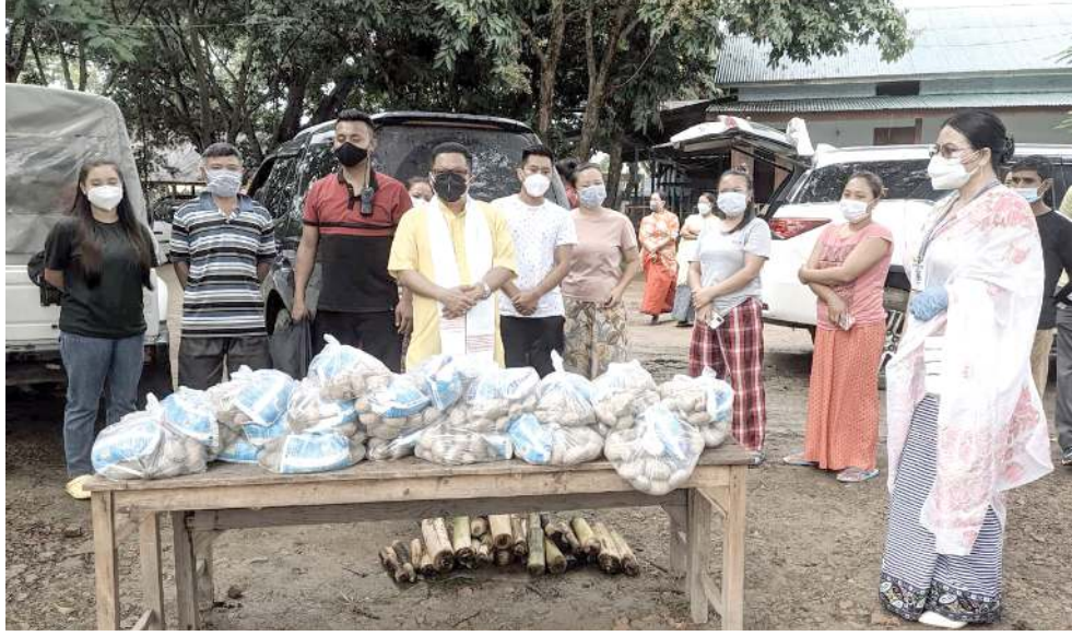
ককচিং এ সীগী মনুং চাং লৈবাক কম্যুনিটি হোম আইসোলেশন সেন্টাৰশিংদা লৈরিবা মীওইশিংদা ককচিং এ সীগী এম এল এ এম ৰামেশ্বৰনা সোসাল এজিউভি ডা. এলিসন অবোনমাই অমদি চাং তম ৰিমেক দিভলপমেণ্ট এসোসিয়েসনগা খুংশল্লুদা চানা থলুৱা পোংলমশিং তেংবাঙ পীথিবা

ষ্টেটশিংদা কোভিডকী কেস হুন্তুখ্রে গুৱাহাটী, জুলাই ০৪ (এজেন্সী): লৈবাক অসিগী অৱাং নোংপোক থংবা শৰুতা লৈরিবা ষ্টেটশিংদা মনুংনা মেঘলয়া নতুনা অতোপ্লা ষ্টেটশিংদা গুইনাদি কোভিড-১৯ লায়না লাইচিং থেংনবগী চাং হাংগা য়েংনরুবা হুন্তুখ্রে হায়রি।