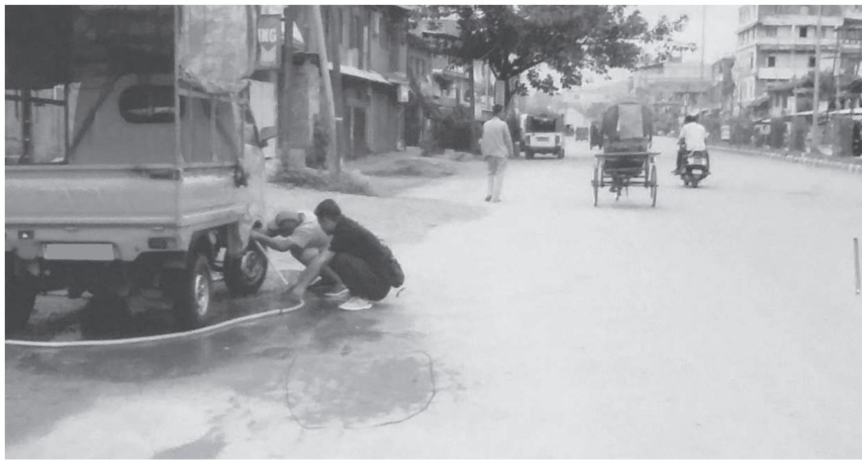
লহীদা থুনা পোটহোল লৈরকুবা, লহীদা নুংতিগী কয়লাস মথজা টোটি দিশিংনা গাড়ি চামজরি