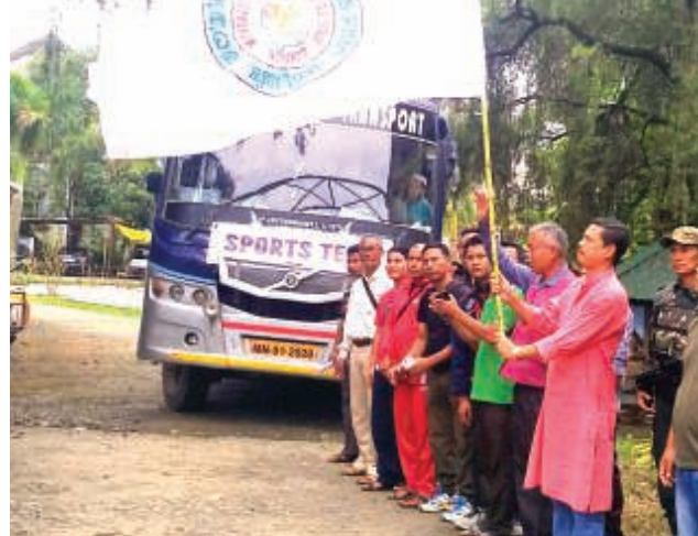
জিৱিবাম, গুগট ০৪ (এচ এন এস) : গুজ জিৱিবাম স্পোর্টচ এসোসিয়েচন (এ জে এস এ), জিৱিবামনা শীন্দুনা জিৱিবাম গভমেণ্ট হায়ৰ সেকেন্দৰী স্কুলগী প্লেগ্ৰাউন্দা খাসিগী তাং ২৭ তগী হৌদনা টিম ১২ না শৰুক যাদুনা চখৰিক্ৰীবা ১৫ শ্বাৰা চান্দী ইংলেন্দনা মেমোৱিলা মিনি বোইজ (অন্দর ১৩) ফুটবল টুৰ্ণামেণ্ট, ২০১৮ গী গুই শামায়িবা লীগ ৰাউণ্ডৰী মেচশিলা পি এম জি কলিনগৰ অমসুং জিৱিবাম অফ সী টাটবুং মায় পাকখ্ৰে।