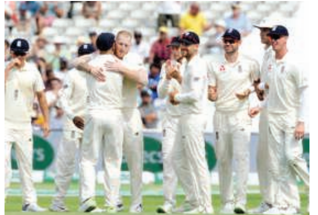
বিবিমংহাম, গুগট ০৪ (এজেকী) : ষ্টেটে মেচ মাজগী সেরিজকী অহানবা মেচতা ইন্দিয়গী যুৱ ইংলেন্দনা ৩১ দা গুই মায়খিবা পাঁত্ৰে।

ইংলেন্দনা টোচ গুডমনা অহানবা ইংলেন্দনা ৩১ দা গুই মায়খি।