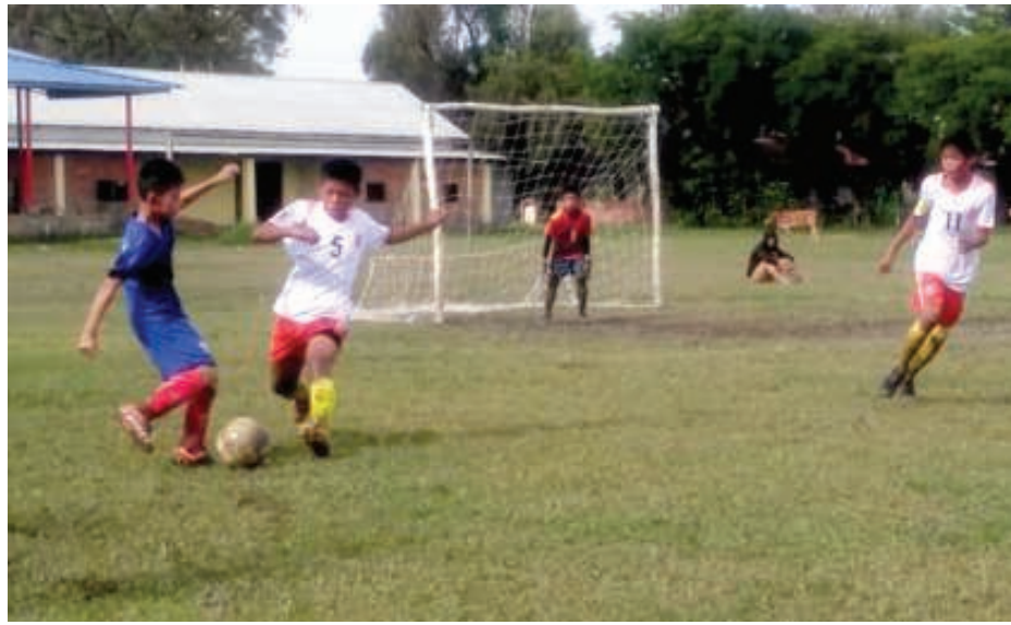
ইফাল, গুগট ০৪ (এচ এন এস) : নোরেকা এক সী ফুটবল লীগ গুৱেজ বুগোদনা শীন্দুনা ইফাল ৰেইজী মনুঃ চনবা লৈবা কোদোস্পোকী মাণ্ড লৈকাইগী এস সী কে প্রাউন্দা থাংজ অমসুং নোংমাইজিং খুইদিগী চখরিবা অহানবা ষ্টেট লেভেল অন্দর ১২ যুথ লীগ ২০১৮ গী গুই সী শামায়িবা মেচশিলা বি এম এস সী তৌবুংখোক, কে এস রাই সী খুর্নাই অমসুং যু জি এফ সী মন্ত্রিপুত্ৰি মায় পাকখ্ৰে।

টিম ২৪ না শৰুক যাদুনা গ্ৰুপ মরি থোকা খায়দোকুনা পাঙথোকপা অহানবা ষ্টেট লেভেল অন্দর ১২ যুথ লীগ ২০১৮ গী গুই সী শামায়িবা মেচশিলা বি এম এস সী তৌবুংখোক অমসুং এস টি এফ সী মন্ত্রিপুত্ৰি মায় পাকখ্ৰে।