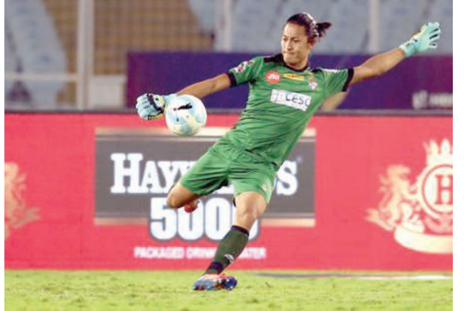
ভেলেপিয়া, গুগট ০৪ (এজেকী) : ইন্দিয়গী মিমং লৈরবা ফুটবল লীগ অমা ওইরিবা বেঙ্গালুরু এফ সীনা স্পেন্দা এঞ্জপাজৰ টুইগী মনুঃ চো মফম অদুগী ফুটবল লীগ এথলৈটিকো সাগুনটিনোগা শামাৰা ফ্ৰেন্ডলি মেচ অমদা বেঙ্গালুরুগী গোলকীপৰ সোৱাম পোইরৈনা ফৰবা মশায়ানা পাঞ্জল হেন্না মায়খীগদবদগী অমসুং ১-২ দা মায়খি।

সীগী জেমসননা মহাকী অনীশুবা গোল চৰুগা অহানবা হাফ লেইবা ফাওবা কে এস রাই সীনা গোল ২-১ দা লৈখি।