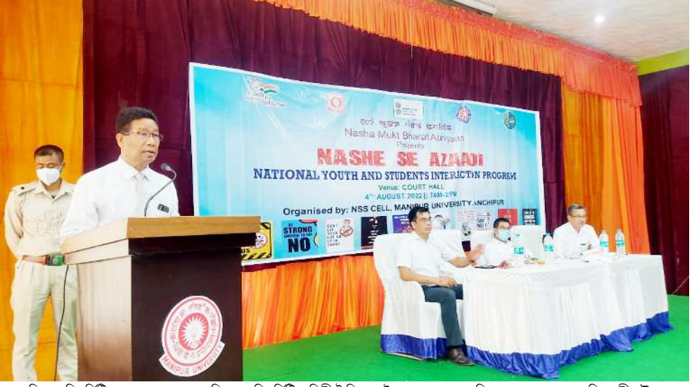
মণিপুৰ যুনিভাৰ্চিটি এন এস এস সেলনা শিন্দুনা যুনিভাৰ্চিটি অসিগী ট্ৰাফিক আইলেন্দদা পাঙথোকখিবা নশা মুক্ত ভাৰত অভিযানগী খৌৱম

পাঙ্কে হায়বগী ৰাখলোনা লোয়ননা থবক তৌৱবদি পাম্লিবা পাদম অদু শোয়দনা ফংবা উমগনি। অসিগুহ্মা পুৰ্কেল শেংনা নহাশিং অসিদা মতম পুহ্মা লৈজগ্ৰা মতেং পীনবা শেম শাদুনা লৈরি। হায়রিবা অসিদা লমাই মীওই অমগী ৰাফল্ম। অসিগুহ্মা মীওইশিং অসিদা অমত্ৰা ওইনা গভৰ্নমেণ্ট ওফিসলশিংগা ৰাখল মায়না থবক তৌমিন্নগদবনি হিৰম কয়া মায় পাল্লা পায়খৎপা উমগনি। গভৰ্নমেণ্টনা পায়খৎপাক থবক খৌৱমশিং মায় পাল্লা পায়খৎপা গুহ্মা মতমদা চাওখৎপা স্টেট অমা শোয়দনা ওইবা উমগনি হায়না ফোঙদোকখিবগা লোয়ননা স্টেট অসিদা কোভিড-১৯ লায়না লায়চং শব্দেদোকপগী চাং হেংগৎপাৰ্জিবা অসিদাগী মীয়াম চেকশিনসি হায়না মখা তানা অপি লৈৱিকি।