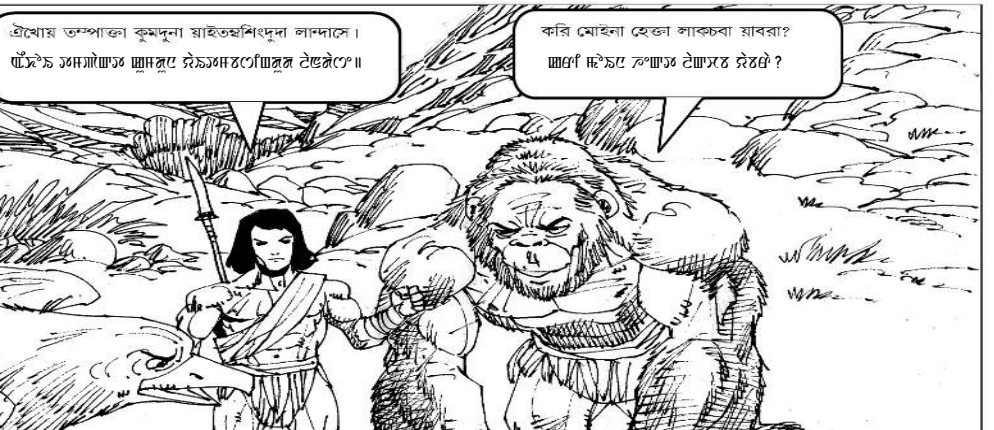
ইতাও যোংজাও, যাইতখনা অইয়োদা হাংকে তৌৱকহ। চুইয়ৈ দাংইজ, দৈচয়ামচপে ঝুইচয়ম লৈয়ৈ চুইয়ৈয়ৈ। হিৰোয় তম্পাকতা কুন্দুনা যাইতহুশিংদুনা লান্দাদে। ঝুইচয়ম চয়মাইয়াম চুইয়ৈয়ৈ দৈচয়ামচপে ঝুইচয়ম লৈয়ৈ চুইয়ৈয়ৈ। কৰি মোহিনা হেজ্ঞা লাক্কৰা যাববা? ঝুইচয়ম চুইয়ৈয়ৈ ঝুইচয়ম চুইয়ৈয়ৈ?