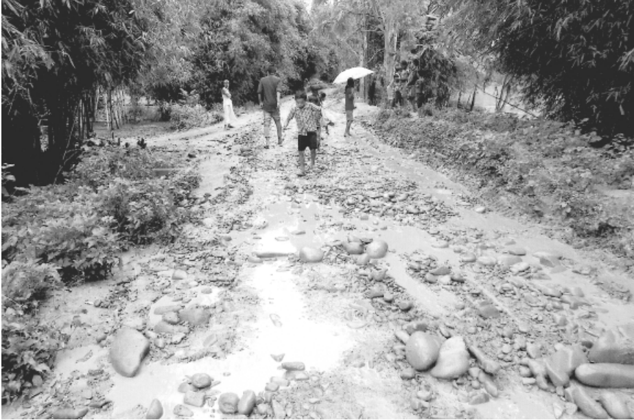
হিয়াংলম এ সীগী মনুংদা লৈবা লম্বীগী হৌজিক হৌজিক ওইৱিবা লম্বীগী ফিডম

হৌজিক চখৰিবা এসেমব্লী অসিদা বিল অমা পুথোকপীৱগা মণিপুৰদা লৈৰিবা প্ৰাইভেট স্কুলশিং অসি শেম্বৱা তকশিনখি। মফুওইনা মেমোৱেৰদম অদুদা যাওৱিবদি লাইৱিক লাইশু হৈৱবা প্ৰাইভেট স্কুলগী ওজা লিংশিং ৬ মুক অমসুং নন টিচিং ষ্টাফশিংগী তলব মতমগা চাল্ৰবা মওংদা ফঙহল্লু। এম এল এ, পঞ্চায়ত্কী মেম্বৰ অমসুং কাউন্সিল্লৰশিং অমদি গভৰ্ণমেণ্ট ইমপ্লোয়ীশিংগী মচা মশুশিং গভৰ্ণমেণ্টকী স্কুলদা লাইৱিক তমহল্লু। বিপি এলগী ফেমিলিগী মইহেৱায়শিংগা প্ৰাইভেট স্কুলদা লাইৱিক তম্মা মতমদা চাদা ২০ তাহনবা অমসুং গভৰ্ণমেণ্টনা চাদা ৩০ মতেং পীবনচিংবা থবক ওইনা পাঙথোকক হায়বনচিংবা য়াওৱি।