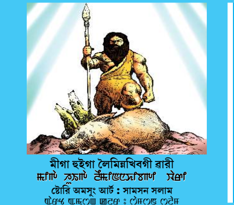
মীগা হুইগা লৈমিখিবগী ৱাৰী

Khuyathong Christian Literature House Building Thangal Bazar Road Khuyathong, Imphal