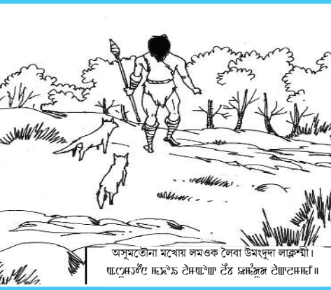
অসমতৌনা মথোয় লমওক লেবা উমদুদা লঙ্কশী