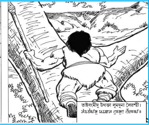
তাইবংমী উথকা লুসুনা লৈৱশী