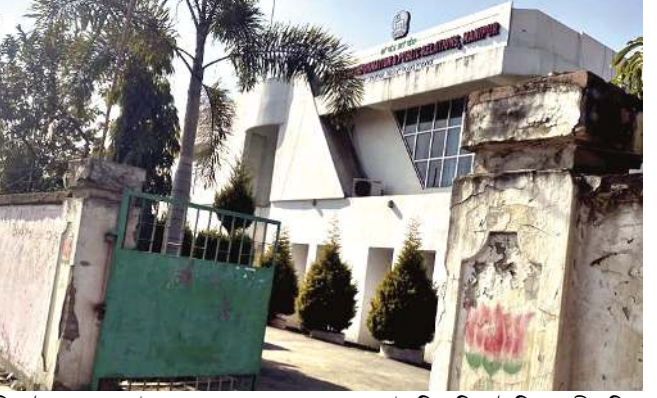
নিতাইপাং চুখেক্তা লৈবা থম্বাল শঙলেনগা মায়োরুনা লৈরিবা দি আই পি আরগী ওফিস

আর টি আইগী পাউজুম ফংলবা মতুংদা হায় কোর্ট ওফ মণিপুরদা বাকংলক্লে