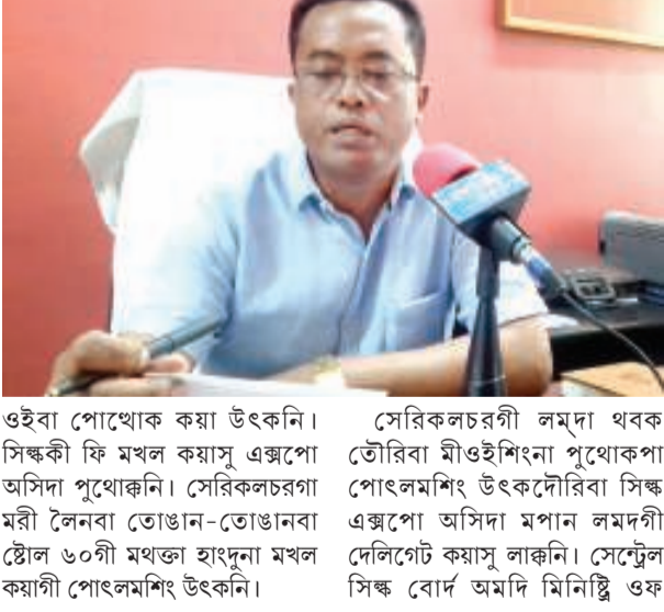
ওইবা পোথোক কয়া উৎকনি। সেরিকলচরগী লমদা খবক তৌরিবা মীওইশিংগা পুথোকপা পোংলমশিং উৎকদৌরিবা সিঙ্ক এক্সপো অসিদা মপান লমদগী স্টোল ৬০গী মখতা হাংদুনা মখল কয়গী পোংলমশিং উৎকনি।