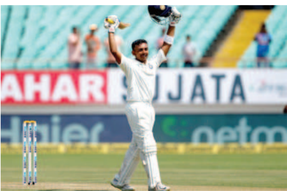
লৌখিবা অদুনা ইন্দিয়াগী ক্রিকেট পুরারীদা টেন্দুলকরগী মতুংদা খ্বাইদগী নহা ওইবা অনীশুবা বেস্টমেনে ওইবগী রেকোর্দ অদু থমখি। রাজকোটতা লৈবা সৌরাষ্ট্র ক্রিকেট এসোসিয়েশন ষ্টেডিয়ামদা ইন্দিয়ানা টেস্ট ওমদুনা বেট্রিং হামা তৌখি। মদুনা পৃথিবী শো অমসুং লোকসে রাখলনা ইয়িংস হৌদোকথিবনি। রাখল রন

রাজকোট, ওক্টোবর ০৪ (এজেন্সী): গুজরাটকী সিটি রাজকোটতা শান্নবা ইন্দিয়া অমসুং ব্রেট ইন্ডিজ ক্রিকেট টিমগী টেপ্ট সেরিজগী অহানবা মেচ অদুদা করিয়রগী অহানবা টেপ্ট মেচ শান্নখিবা পৃথিবী শোনা সেধুগরি লৌবা ওমদুনা ইন্দিয়াগী ক্রিকেট পুরারীদা মমিং লৈরবা শান্নরায় সচিন টেন্দুলকরগী মথংদা খ্বাইদগী নহা ওইনা অহানবা টেপ্ট মেচতা সেধুগরি লৌবা ওল্ল টেস্টমেনে ওইখ্রে।