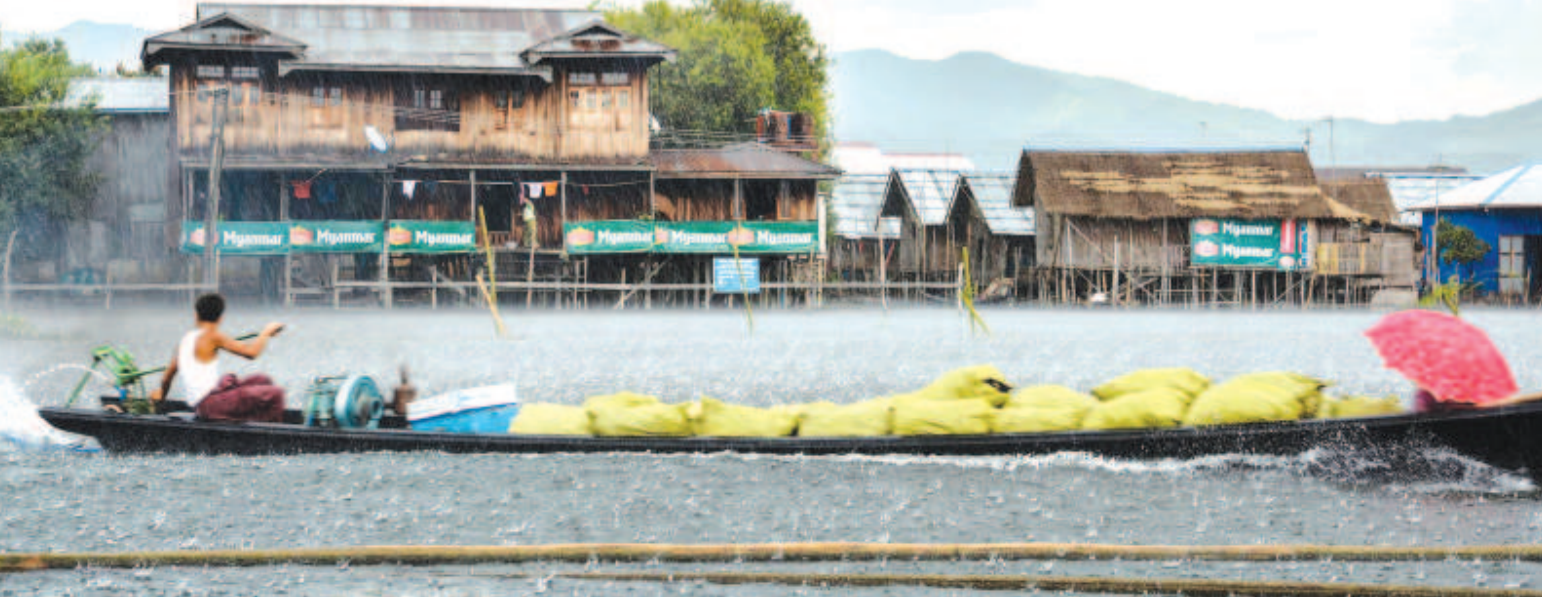
ইনলে লেকপু চংথোক-চংশিনগী পাম্পে ওইনা শীজিলবা।