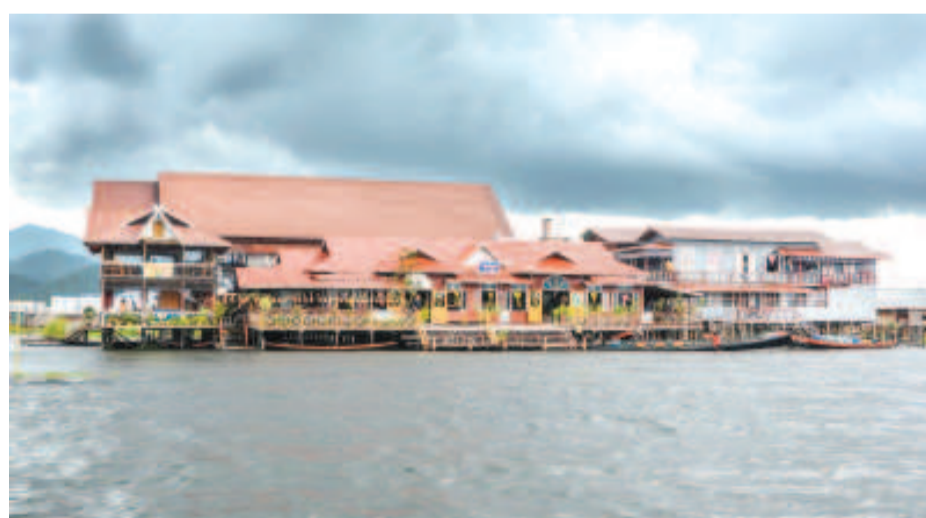
ইনলে লেক্তা শারিবা রেষ্টুরেন্টশিং।