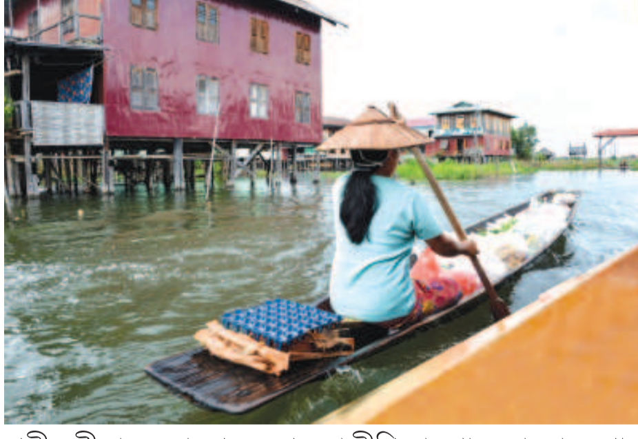
খুম্মী নুপীজা অমনা থেংন-থেংনবা মীশিংদা পোং য়োনবা চংপা।