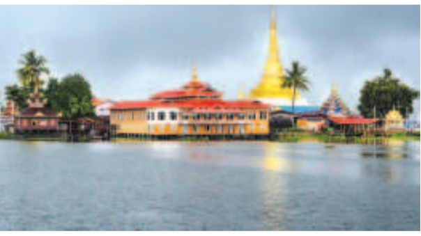
টুরিষ্ট এট্রেকশনগীদমক ইনলে লেক্তা শারিবা পগোদা।