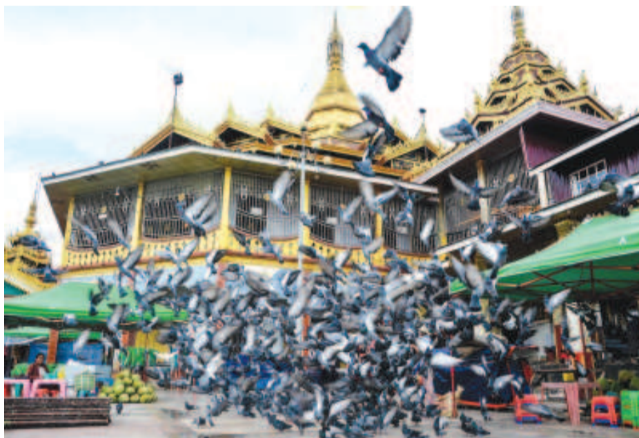
পগোদা চাক্তারিবা খুনশিং।

DIPR না শীন্দুনা সেপ্তেম্বর ৯ দগী ১৭, ২০১৮ ফাওবা চংখিবা প্রেস কন্ডক্টেদ টুরদা কাপ্লকপা ইনলে লেক অমসুং মফমদুদা খুন্দারিবা মীয়ামগী ওইবা চাউরাকপা ফোটো পাউদম।