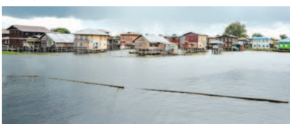
খুঞ্জং অমা ওইনা পুমা খুন্দারিবা ত্রেদিমেলগী ওইবা যুমশিং।