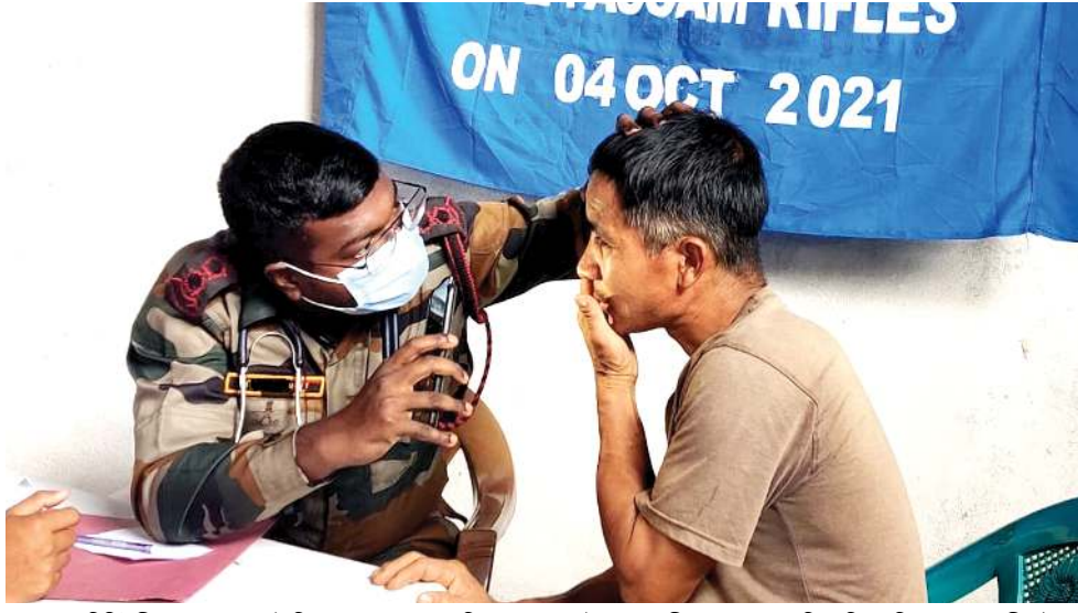
কামজোং দিত্তিকী মনুং চনবা মৰাই ভিলেজতা শংকক বটালিয়ন অসাম রাইফলসনা শীন্দুনা পাঙথোকখিবা ফ্ৰি মেডিকেল কেপ্পকী থৌরম

অসিগা মৰী লেননা ফেশ্বক পেজ অমদা ক্ৰেম অসি তৌরকখিবনি। লালহৌবা প্ৰপ অসিনা শীজিমাৰিবা ফেশ্বক পেজ অদু সাইনকুপাৰ নোংগ্ৰে কেবা মীওই অমনা চ্ৰাফিবনি হয়রি।