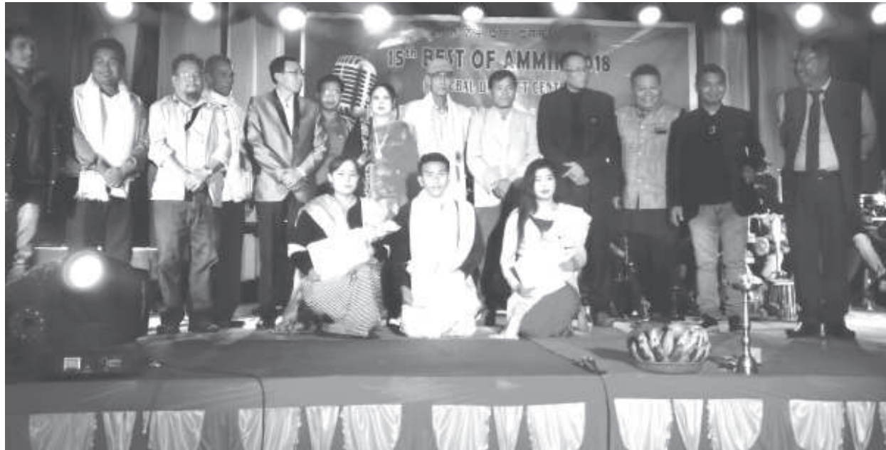
খোঁবাল মেলা গ্ৰাওন্দদা পাঙথোকখিবা ১৫ শুবা বেঠে ওফ অমিক ২০১৮ গী প্রিলিমিনরি রাওন্দদা খনগৎলাবা মকোক-মথং তারবা অহম