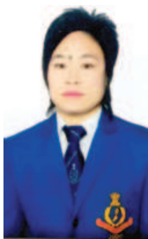
ওইনাম রাশেশ্বরী ইন্টরনেশনাল জুদোকা