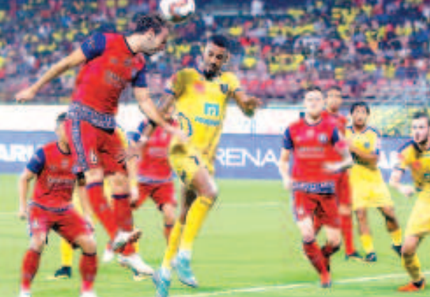
মায়কৈদগী ফনা ক্লা হোংনবরসু পাঞ্জল চনবা গুন্ডনা লৈখি।

অমসুং জমসেদপুর এফ সী পাঞ্জল ১-১ চমরগা দ্রো চংখ্বে।