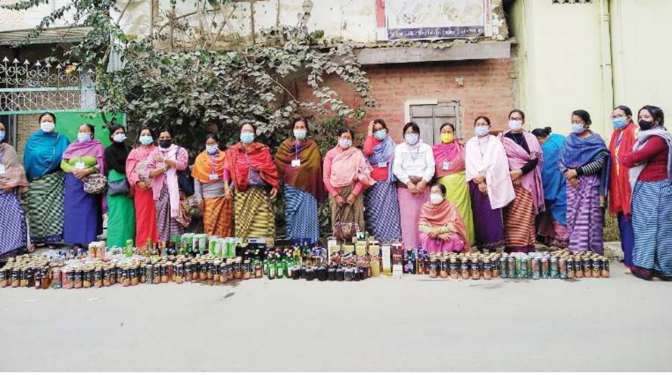
ইফাল ইষ্ট দিষ্ট্ৰিক্টকী মনুং চেনবা সোহিবম লোকাই মেৰি লৈৱক্ৰুগী কাদগী অখনবা টিম অমনা ফাগতুনা মাঙহন অকহনব্বা লুপা লাফ ২ ৰোমগী ওইগদবা যুগাশিং

গুৱাহাটী, দিচেম্বৰ ০৪ (এজেন্সী): অব্রাং নোংপোক লমদমগী অহানবা কন্সাইল পাইলোট ব্ৰেনিং ইন্সটিটিউট মথং চহীদগী লমদম অসিদা উৱগনি। কন্সাইল পাইলোট ব্ৰেনিং ইন্সটিটিউট অদু নোৰ্থ অসামগী লখিম্পুৱ দিষ্ট্ৰিক্টতা মথং চহীদগী জনুৱাৰীদগী ওপৱেসন হোৱগনি।