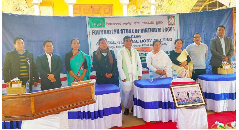
মণিপুর ষ্টেট ৱেলফেৰ লাইভলিহুদ মিসনগী মখাদা শেমগলকখিবা ইমা ভিলেজ লেভেল ফেদেৰেশনগী জি বি মিটিংদা শৰুক যাইবশিং

ৱাৱোল পীৱদুনা ফোণ্ডদোকখিবা, লংথবাল মন্ত্ৰিখোং অৰাং লৈকায়গী খুংশিন্না থোং অসি লৈৱমদৰকী