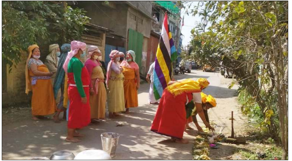
মৈতৈ লাইইংগা মৰী লৈননা পাঙথোকপা লমতা থাংজলী থৌৱমদা উৰিপোক তৌৱাংবম লৈকাইগী ইমাশিংনা শৰোই থাংবগী থৌৱম পাঙথোকখিবা