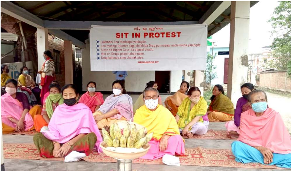
চান্দেল এ দি সীগী হামগী চেবরেনে লুখোশৈ জৌ থাদোকখিবা কৌলে দ্রগ কেসতা চেবাবা মীওইশিং থাদোকপদা যানিংদবা ফোঙদোকুনা ৰাকং মীফম ফমখিবা

আইজেল, এপ্রিল ০৫ (এজেন্সী): সাউথ মিজোরামগী লুংলৈ দিল্লীতকী মনুং চ্চা ইন্দিয়া বাংলাদেশ বোৰ্দৰ পৰিহা লৈবা লুংলৈ ডিল্লৈ দা মশক খঙৰবা লায়না অমনা নাবদগী যামদ্রবদা ওক ৮৭ শিৰে। ওকশিং অদ অট্রিকান স্বইন ফিড্ৰনা নাবদগী শিবিবা ওইৱদা যাই হয়না জিনরি।