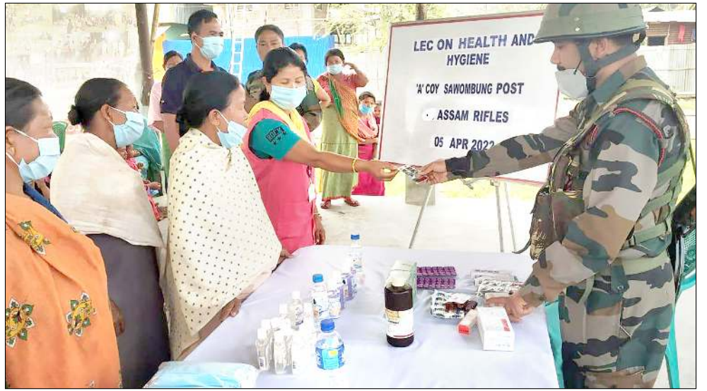
আই জি এ আৰ (সাইথ) কী লমজিং মখাদা মন্ত্ৰিপুত্ৰি বটালিয়ননা শীশুনা ইফাল ইষ্টকী তখেলদা হেল্ঠ এন্ড হাইজিনগী মতাংদা এৱোৱেনেস লেকচৰ পীৰিবা