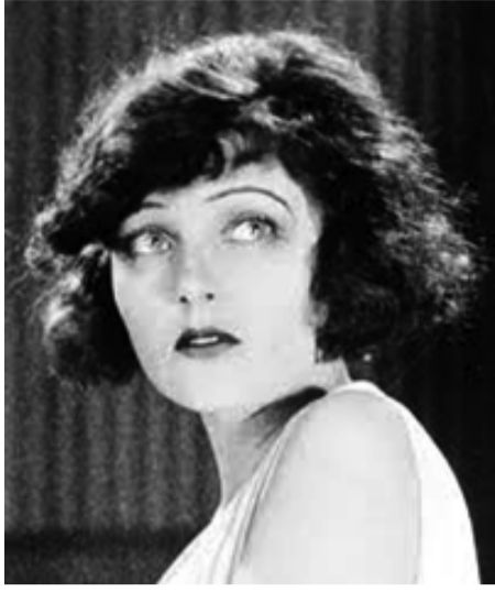
American Comic Marie Dressler