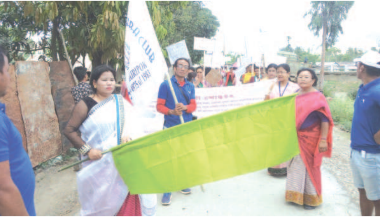
বিসেম এগেল ফাইনাম হাইব্রিপোক মালোমগী হাইফ লমজিং ব্লব অমদি মৈরা পায়বিশিগা খুংশুন্দনা শীল্লগা ফবতা লমচং চংপা নুপা-নুপী অনীমক চৈরাক পীগদবা অকনবা লো শেমশু হায়বা দিমাদ তৌরদুনা চেখিবা বাকৎ খোঙচৎকী শভম