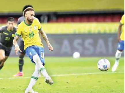
অনীশুবা হাফ হৌরকপা শান্নবগী ৬৫ শূ বা মিনটতা ব্রাজিলগী মায়থীবা পীদুনা পূনা পোইন্ট ১৫ ফংথিবগা লোয়ানা ক্যালিফাই ওইবগী লম্বেল নকথ্রে।

সাও পাওলো, জুন ০৫ (এজেন্সী): কটারনা যুপু ওইরগা কুমজা ২০২১দা পাউথোক্কা দৌরিবা মালেমগী ফুটবল মশাগী হুইয়ানগী থাক রাংবা টুর্নামেন্ট ফিফা বর্ড কপকী সাউথ অমেরিকান ক্যালিফায়িং টুর্নামেন্টতা ব্রাজিলনা ইয়াই নুপীগী ইক্কাদৌরবু পাঞ্জল ২-০দা মায়থীবা পীদুনা পূনা পোইন্ট ১৫ ফংথিবগা লোয়ানা ক্যালিফাই ওইবগী লম্বেল নকথ্রে।