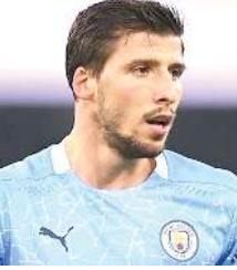
২০০৬-০৭ অমসুং ২০০৭-০৮দা মনা অসি অনীরক হুয়া ফংথ্রেবনি।

লন্দন, জুন ০৫ (এজেন্সী): হুইয়ানগী প্রেমিয়র লীগগী টাইটল লৌবা ওমগনি অদুগা যুরোপিয়ন চেম্পিয়নশিপ লীগগীনা বর্ড জুদোকা মণিপুর মচা লিকমাবম সুশিলা টোকিও ওলিম্পিক্স ক্যালিফাই ওইনবা হোংনগদৌরি।