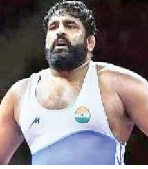
অসিগী দিসেম্বর থা ফাওনা অথিংবা লৈরকপা মরুওইনা টোকিও ওলিম্পিক্স গেমসকী-দমজ্ঞা কিলোগ্রাম ১২.৫কী নুপীগী রেটলিং অমদি ইন্দিয়ানগী মনুংদা অসি অনীরক হুয়া ফংথ্রেবনি।

নু দেল্লী, জুন ০৫ (এজেন্সী): টোকিও ওলিম্পিক্স গেমসকী-দমজ্ঞা কিলোগ্রাম ১২.৫কী নুপীগী রেটলিং অমদি ইন্দিয়ানগী মনুংদা অসি অনীরক হুয়া ফংথ্রেবনি।