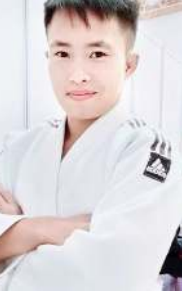
চুপা পাউথোক্কা দৌরি ওলিম্পিক্স ক্যালিফাই ওইনবা হোংনগদৌরি।

নু দেল্লী, জুন ০৫ (এজেন্সী): জুদো অথেন্ডিকগী হুইয়ানগী কোনুং বুদাপেস্টতা পাউথোক্কা দৌরিবা বর্ড জুদো চেম্পিয়নশিপতা শরুক যাদুনা ইন্দিয়ানগী নুপীগী জুদোকা মণিপুর মচা লিকমাবম সুশিলা টোকিও ওলিম্পিক্স ক্যালিফাই ওইনবা হোংনগদৌরি।