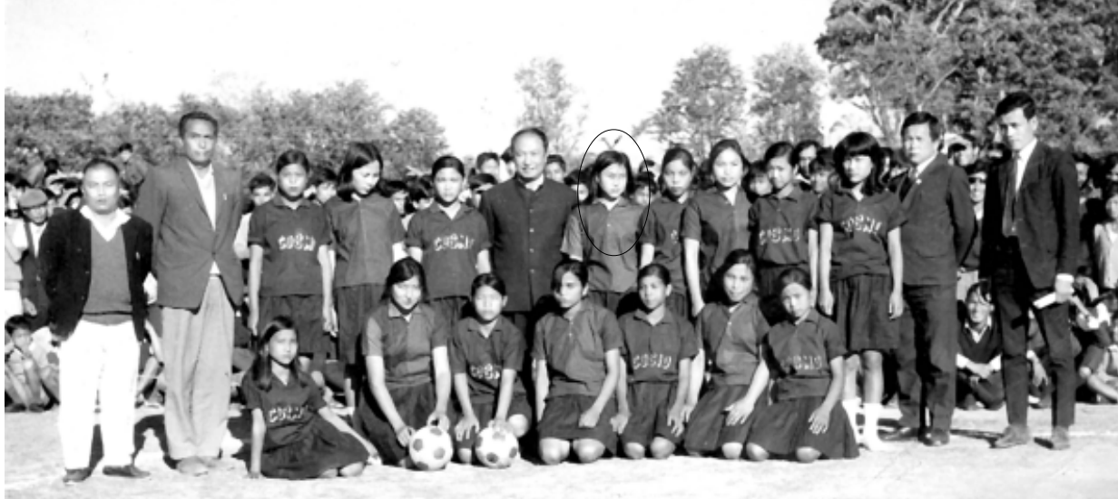
স্টেট গেমস বোলিবোল, ঈ এস যু - কোসমো (১৯৭১)

(হানুগী মখা...) অঙাং ওইরিঙেইদা ইশাসি প্রাদিক পাই। চেনবা চোঙবা, এঞ্জারাইজসিসু চাং নাইনা তৌজবনিনা ইশাসি ফজনা অনুম তাশিল্লি। স্কুলগী ওইনা তৌবা 'এনু-এল স্পোর্টস মীট' কী ফস্ট প্রাইজগসিদি পুঞ্জপ-পুঞ্জপ ফনা যান্দি এনা ফজলকপসি। শান্নবসিদি অদুগী মতিক থরায় যাওজরকই। ওজাশিংনু ফজনা খঙবিবা ওইনা তৌরদনা, বাংথে গার্লসকী শান্না খোৎনবগী টিম অমা শেমগনি হায়রবদি ঐখোয়বু হামা কৌথোকপীরকই। ঐখোয়না স্কুল তল্লিঙে মতমদদি স্কুল গেমসকা, মণিপুর স্টেট গেমসকা অনিসি যান্দি চাউনা চাউনা পাঙথোকসি। অনিসি যান্দি চাউনা চাউনা পাঙথোকসি। চহীগী ওইনা পাঙথোকপা মতমদুনা মাগী মাগী স্কুলশিংনা চেম্পিয়ন ওইনবদি স্পোর্টসতা মমিং লৈবা, তাকপী-তন্বীবা চঙখানবা ওজাশিংসি থওইনা নেক্সা ত্রেণিং তৌহনবা, কোচিং পীহনবা মসিগুস্তিসু অদুম