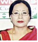
— মুজুম শান্তি — (শোখৰবশিঙা কথোকচৰি)

মণিপুৰ মীয়ামগী অৱাৰা অমগী মথজা অৱাৰা মথং-মথং মায়েক্ৰি। মীওইবনা অৱাৰাসি লাকপা মতমদা এগী নুৰুবা মৰী-মতা, মৰুপ-মপাং নীংশিংনৱক্ৰি। অৱাৰাবা শৰুক যামিৰবা কয়না নুংশিনবগী অচেংপা লিপুন অমা ওইৱক্ৰি।