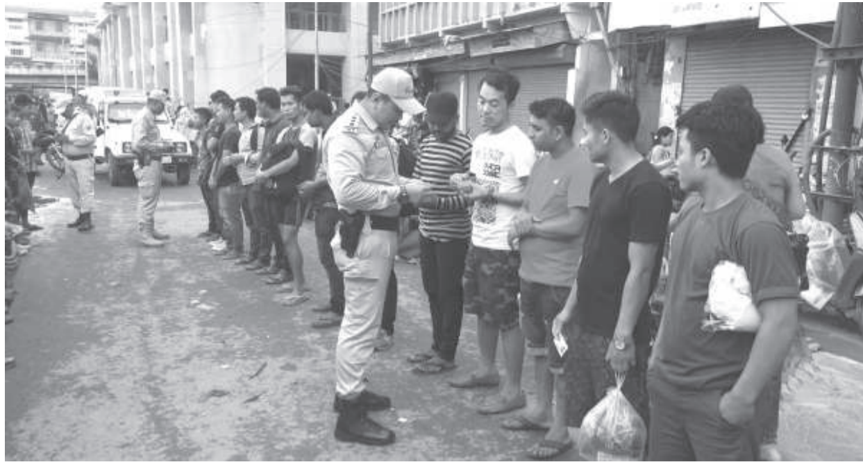
ইন্দিয়েনসেস দেগী মাঙওইননা চেকশিন খৌরাং লৌখংপা ওইনা পুলিসনা স্থাইরহন্দ কৈখেলদা অচং-অজকশিং চেক তৌবনী শক্তম