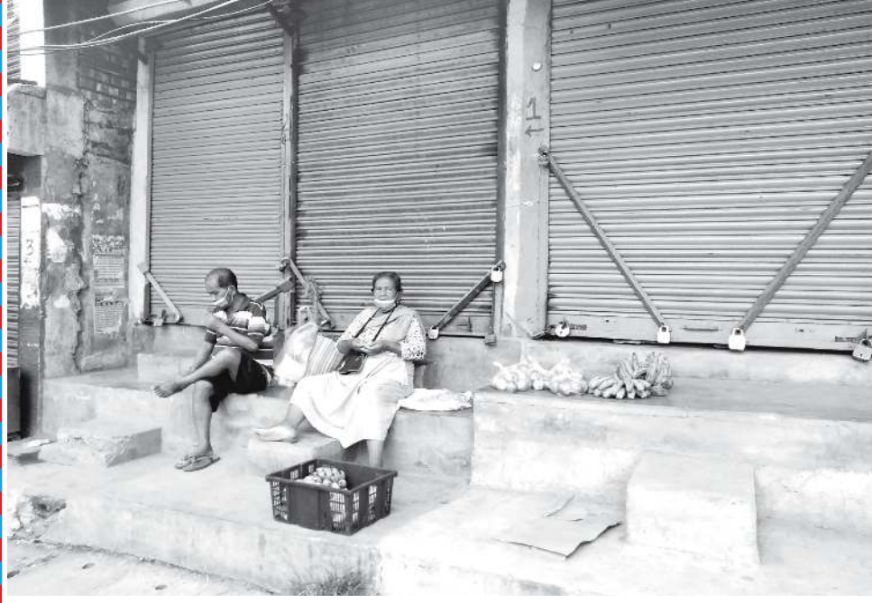
থবক্তি লেপ্পা মাদে, শফিঁমু/লোকদতিন ওইরোনা চাদনা লৈবা মারদি থখামসু পোখাশিংই (ইম্ফাল)