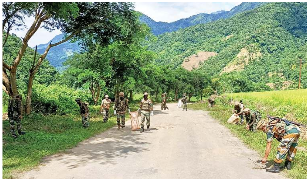
২২ সেপ্টেম্বৰ এ আৰ-আই জি এ আৰ (ইষ্ট) কী মীংয়েং মখাদা ৪৪-অসাম ৰাইফলসনা স্বছ ভাৱত অভিযানগী শৰুক অমা ওইনা কাংপোকপী দিষ্ট্ৰিক্টকী মনুং চমা লৈবা টি ৰাইচোং এৱিয়াৰা শীং-শেংবগী থবক থোঁম অমাপাঙথোকখিবা