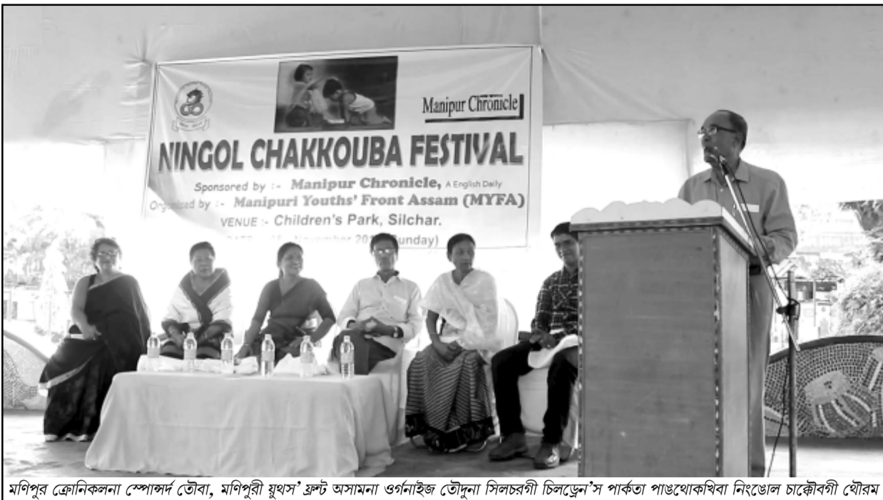
মণিপুৰ ক্ৰোণিকলনা স্পোন্সৰ্ড তোৰা, মণিপুৰী যুৱস' ফ্ৰন্ট অসামনা ওৰ্ণনাইজ তৌদনা সিলচৰ্গী চিলাট্ৰেন'স পাৰ্কত পাণ্ডথোকথিবা নিঃশেৰা চাক্ৰৌবী যৌৱম

আমাজুথোংগী অকোয়বদা সনাইশুমা থোন থোন লাউনা চাউনা লৈবা, খোঙ হাৱুদা চিকপা নাৰা, য়াম্মা শাৰা, অমাজুথোং মনুংদগী মচুম দ্ৰোপ দ্ৰোপ তারকপা, পুজা গ্যেপ্তিক কাৱৰগা চাবা থকপা যাদবা, য়েংকী হকচাং জ্ঞায় অমা চিকপা নাৰা তৌৱগা শাগল নাম্মা শিখবগুম তোৰা ফহনবগী ওজা Zia-UI-Haque পু থাগচরি