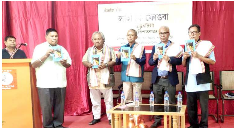
মেনম পল্লিকেননা শীদুনা দা. মেনম অচৌবা শান্তিনা সংস্কৃত লোনদগী মণিপুৰী লোনদা হুদোকপা ভৰ্ত্তিৱিশত্ৰয়ম হায়না মিংখোনবা লাইৱিক ফোণ্ডাৰগী যৌৱম

অমৰোমদা অসিগুৱা পামদবা যৌদোকশিং অসিগা মৰী লৈননা মায়কৈ খৰদী কমপ্লেন লাকপদনী গুৱাহাটী প্ৰেস ক্লাবনা থিজনবগী থবক চখাৰা হৌখিবনি অমদি অসিগুৱা যৌওংশিং অসিগা জেনেলিষ্ট খৰা মশক খঙলে অমসুং মথোমগী মথক্তা এঞ্জন লৌখংলগনি হায়রি।