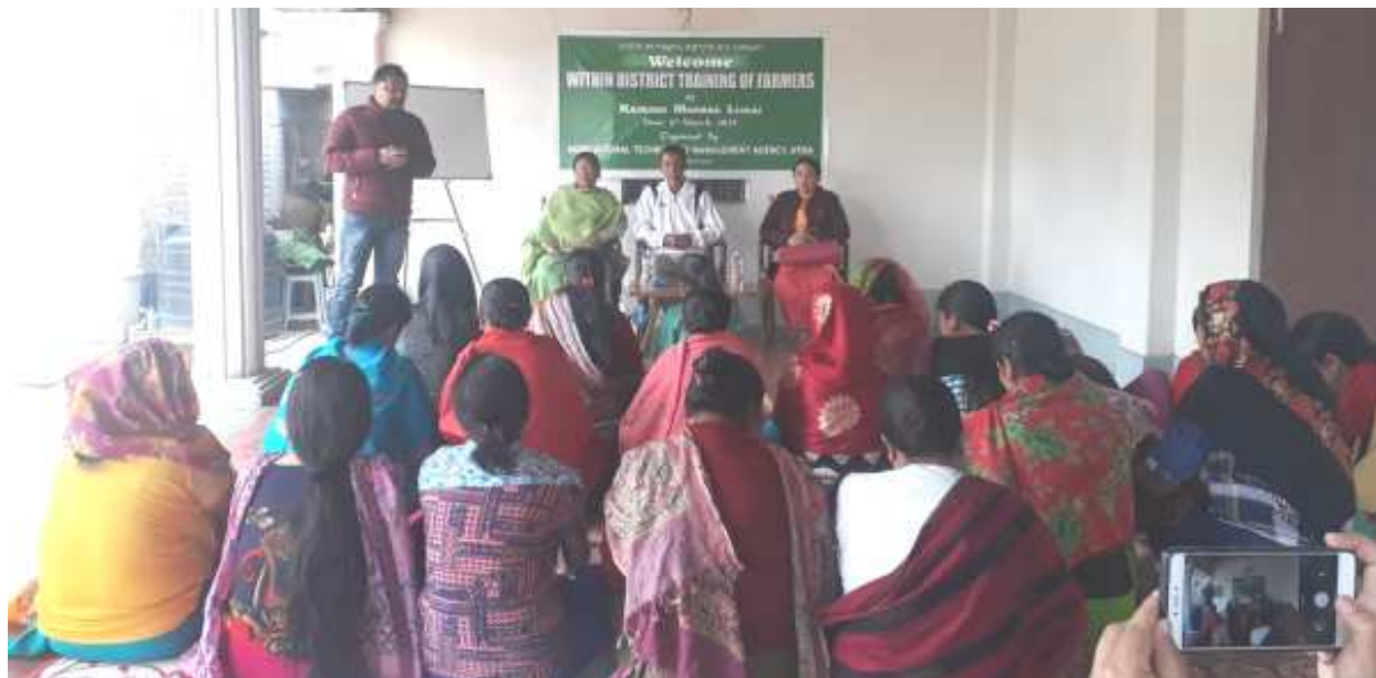
ওসি এগ্ৰীকলচর টেকনোলজি মেনেজমেন্ট এজেন্সি (এ টি এম এ) ইমফাল ইষ্টনা কাইরং মমাঙ লেকাই যুনিট কমিউটিং খুংশন্ননা শীন্দনা নোংমগী ওইবা বিদিনি দিক্তিগ্ৰেইন প্রোগ্রাম অমা কাইরং মমাঙ লেকাইদা পাঙখোকখিবগী শক্তম

চ্যাপ্ৰসেপ্ৰ/ পুজা গ্যাষ্টিক কাবা, চাবা থকপা যাদবা, চাবা তুমদবা, নাকোংদা ওংবা, খোঙ-খুং শজিং তোয়না হোঁবা, তাং-তাং চিকপা-নাবা, অমাংখোঙদা নুংশিং চেলু যাদবা, চিনলেমাদা খেগৎলকপা ফহনবগী ওজা জিয়া উল হকপু থাগৎচরি