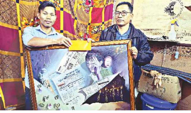
মীয়ামদা উহল্লকপদা পূক্রিং থৌগংগা ওইনা লানপাউ পাউচৌগী মায়কৈদগী পাউচৌ অসিগী উসি শেলগী তেংবাঙ অসি মহাক মশাদা হুইয়েন সিদিয়র ... মখা লমায় ৩ কলম ২