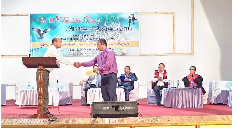
ওল মণিপুর ট্রিবেল যুনিয়ন (এমটিউ) গী ১৬ শুব ফাউন্ডেশন দে যৌরমদা দাইজ মেম্বর ওইনা শরুক য়িবা মীওই অমদা এমটিউ এডভাইজরনা ইকাইখুয়া উংগা

ইষ্ট থাসি হিলসতা পাঙথোকখিবা মইহোয়লিশিংগা উন্নয়নগী যৌরম অমদা মহাক্সা মখা তানা হায়খিবা, মতম মতমগী ওইনা লাক্সিবা অণবনা অমদি অহোংবশিং অসিগা লোয়না ইনফ্রাষ্ট্রাকচার মইহোয়লিশিংনা চংলবা মতমদা চাওখাং থান্নাই অম ওইবা গুণগনি। মরম অদুনা মেথোয়বু পুঞ্জিং থোংগা ওইনা পি সী টেলেটশিং লেন্না য়েহোয়গনি মহাক্সী লৈঙাক্সা ফিরেপ লৌখিবনি।