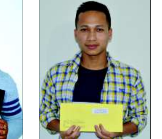
হুইয়ান লানপাউ লিট'ৰেৰি কুইজ নম্বৰ ৭০ গী বিন্নর ওইখবৰ মাইবম নিলান্দো

মইহেৰাইশিংদা অসুঁকী মতিক কামবা পিবতা নতন মনিপুৰী লিট'ৰেচ'ৰ চাউ খংনবা হেংনবদা অচৌবা য়ৌদাং লৌরি।