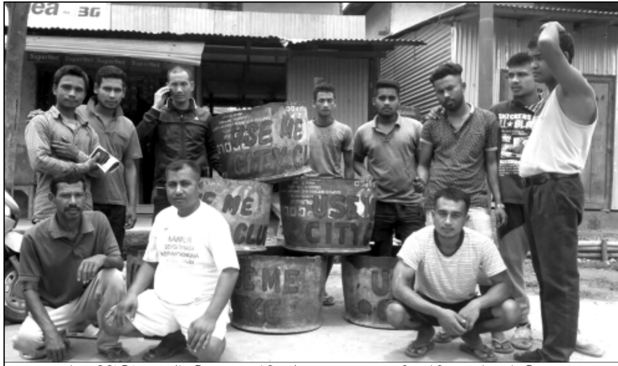
যৌবাল ডিভিউকী হৈবোক পাট-২ চাঁহদোম্পোক আহিদিয়ল টোপ মুখ ক্লবনা কোনবা মফমশিংদা দষ্টবিন থল্লাব যৌৱাং তৌবনী শত্ৰম

চাঁহদোম্পোক/অমাঙথোং মনুংদা মতুম ওইনা লৈৱগা, খোঙ হান্সা খুদিংগী ঈ কাপথোরকপা, খোঙ হান্সা হামেং মথিগুয়া হান্সগা খোঙ শেন্গা হান্সা যাদবা, অমাঙথোংদা মৱেং-মৱেং চংলগা যান্না হাক্‌চবা, খাঙ নাবা, তাং-তাং চিকপা ফহনবগী ওজা জিয়া উল-হকপু থাগংচরি