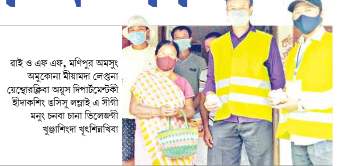
রাই ও এফ এফ, মণিপুর অমসুং অমুকোনা মীয়ামদা লেপুনা য়েছোরকিবা অয়ুস দিপার্টমেন্টকী হীদাকশিং ওসিস লম্বাই এ সীগী মনুং চনবা চানা ভিলেজগী খুঞ্জাশিংদা খুংশিমাখিবা

ইশাগী ইনভ্রাদিয়ন রিদম মমুং তানা খঙদুনা হকচাংগী সাইকলশিং ফগংহনবা-১ লামায় ২ মাইবমলোৎপা চাংদা জপানিজশিংগী ওইবা শান্তিগী লাইশঙ শারগনি লামায় ৩ লৌমীশিংদা হার ফংহনবগী সিস্টেম অসি খরা কুপা মীংয়েং চঙহমই লামায় ৬ অসাম-মিজোরাম ওমথৈ শরুজা হৌজিকসু ইকনমিক ব্লোকড চখরি লামায় ৭