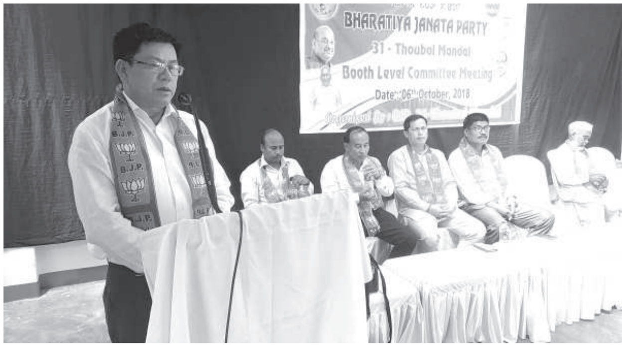
খৌবাল বাজারদা লেবা লেতাছুম মদপতা বি জে পি খৌবাল মদলগী ওইনা চহীগী ওইবা নুঠ লেভেল কমিটিচী মীক্ষম পাঙখোকপা

টোপুখোম/পুত্তা গোল্টিক কাবা, গোল্টিক অদু খবাত্তা চেনখংলগা থবাক নাবা অমদি যৌনাওদা ইফনদা ফুল্লগা লেবঙম তৌবা, ওকশম মরি নাবা, শাগন অনীমক চিকপা নাবা, পুজা গোল্টিক কারণ চাবা তুমদগা খোঙ হাম্মিং হাম্মিং তৌরগা লেবা ফননবগী ওজা জিয়া উল হকপু থাগচরি