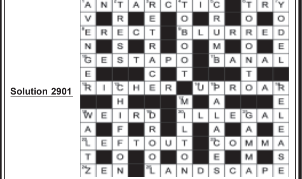
SOLUTION ON NEXT ISSUE

ACROSS 1 Scheme (4) 3 Vindictive (8) 9 Backing (7) 10 Black and white beast (5) 11 Furious (5) 12 Equipment (6) 14 Language of Israel (6) 16 Wager (6) 19 Artist (anag) (6) 21 Rest period (5) 24 Yes, slyly (2-3) 25 Watch attentively (7) 26 Stopped (8) 27 Affirmative votes (4) DOWN 1 Imitative artistic work (8) 2 Greek vowel (5) 4 Small and dainty (6) 5 Theme (5) 6 Organisation of admirers (3,4) 7 Be in front (4) 8 Cartoon spinach eater (6) 13 Devil-may-care (8) 15 Purveyor of meat (7) 17 Waylay (6) 18 In one's own house (2,4) 20 Cricket trophy (5) 22 Ahead of schedule (5) 23 Castro's land (4)