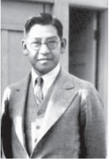
Charlie's driver Kono